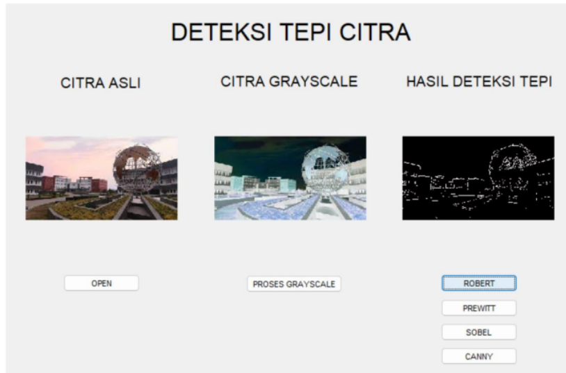
Gambar 2. Deteksi tepi menggunakan operator Robert