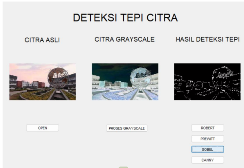
22 Gambar 4. Deteksi tepi menggunakan operator sobel