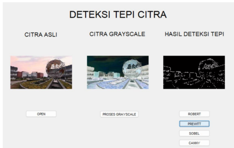
Gambar 3. Deteksi tepi menggunakan operator prewitt