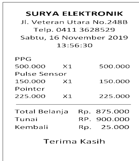
Gambar 3. Objek struk