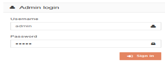
Gambar 2. Antar Muka Login

Tampilan antar muka login sebagai awal untuk masuk sebagai administrator dilihat pada gambar dibawah ini: