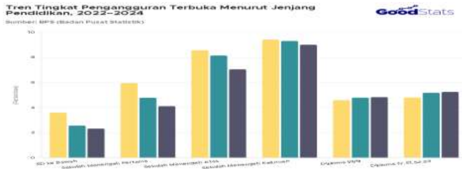
Gambar 1. Tingkat TPT menurut tingkat pendidikan tertinggi yang ditamatkan pada bulan Agustus 2022- Agustus 2024

Salah satu penyebabnya adalah lemahnya softskill dan motivasi belajar siswa. Deputi Menteri PPN/Kepala Bappenas, Subandi (2017), menyebutkan bahwa rendahnya daya saing lulusan SMK disebabkan oleh kurangnya kemampuan non-teknis seperti komunikasi, kerja sama, serta inisiatif. Selain itu, nilai rerata hasil Ujian Nasional siswa SMK dalam beberapa mata pelajaran umum juga masih rendah dibandingkan siswa SMA. Subandi mencontohkan kemampuan dalam berbahasa manual. Menurutnya berdasarkan hasil Ujian Nasional, rata-rata nilai matematika, sains, dan kemampuan membaca, siswa SMK tidak lebih tinggi dari nilai siswa SMA. menunjukkan nilai rerata per jurusan di SMA sebagai berikut: jurusan Bahasa sebesar 50,80, jurusan IPA sebesar 51,00, jurusan IPS sebesar 45,69, jurusan Keagamaan sebesar 51,35. Lain halnya pada SMKS, nilai rerata tiap mata pelajaran terlihat lebih rendah dari rerata nilai ujian SMA dengan mata pelajaran Bahasa Indonesia sebesar 63,80, Bahasa Inggris sebesar 40,59, Matematika sebesar 33,73, dan Kompetensi Keahlian(Jurusan) sebesar 42,73. Data tersebut menunjukkan bahkan nilai rerata ujian nasional SMKS pada penjurusan bidang keahlian atau kompetensi masih lemah.