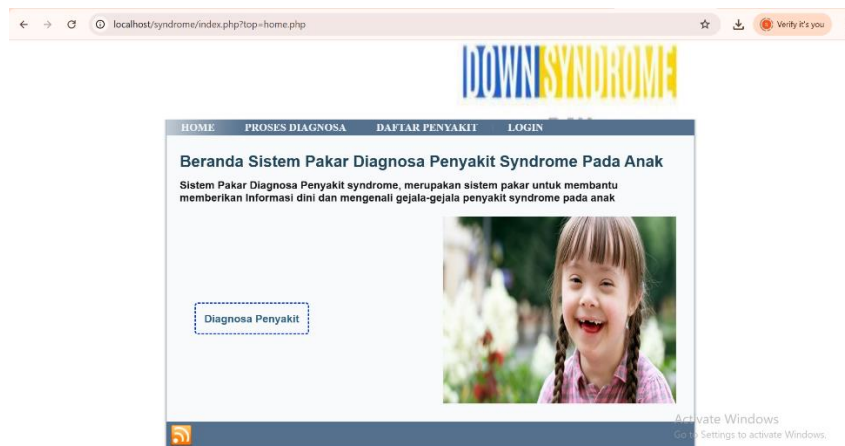
Gambar 1. Halaman Beranda

Pada halaman ini berisi menu home, proses diagnosa dan login yang dapat dilihat pada Gambar 1. dibawah ini: