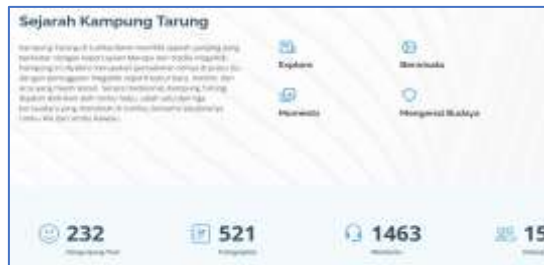
Gambar 3. Halaman Tentang.

Pada halaman ini, menampilkan informasi tentang sejarah kampung tarung, Pengunjung/hari. Untuk mengakses halaman ini, pengguna harus memilih dan klik pada menu tentang pada navigasi bar.