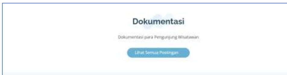
Gambar 4. Halalman Dokumentasi.

Pada halaman ini, menampilkan foto dokumentasi pengunjung di kampung adat tarung, Pengunjung/hari. Untuk mengakses halaman ini, pengguna harus memilih dan klik pada menu dokumentasi pada navigasi bar. Dan untuk melihat semua postingan dokumentasi gambar atau foto, pilih dan klik pada tombol Lihat Semua Postingan yang di tunjukan pada Gambar 4.