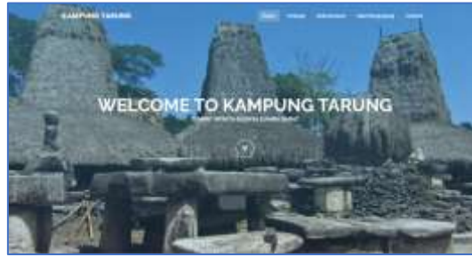
Gambar 2. Halaman Beranda.

Halaman ini merupakan halaman awal pada saat website diakses, terdiri dari beberapa menu yaitu home, tentang, dokumentasi, kata pengunjung, dan contact