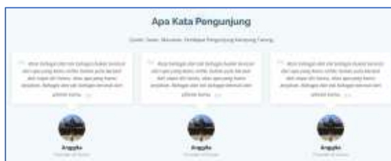
Gambar 5. Kata Pengunjung (testimoni).

Pada halaman ini, menampilkan testimoni pengunjung tentang kampung adat Tarung. Untuk mengakses halaman ini, pengguna harus memilih dan klik pada menu Kata Pengunjung pada navigasi bar.