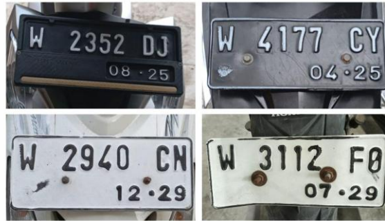
Gambar 2. Contoh Sampel Citra dari Dataset Primer

yang realistis untuk merepresentasikan tantangan di dunia nyata. Contoh sampel dari dataset tersebut disajikan pada Gambar 2.