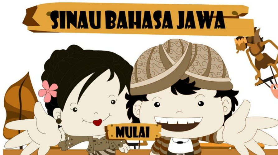
Gambar 2. Halaman Awal Pada Media

Gambar diatas merupakan tampilan awal pada media yang telah dirancang dan dibuat oleh peneliti.