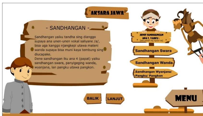
Gambar 7. Tampilan Sandhangan

Gambar diatas merupakan tampilan sandhangan aksara jawa untuk siswa mengetahui apa saja sandhangan aksara jawa.