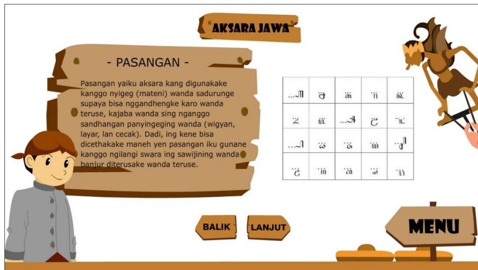
Gambar 6. Tampilan Pasangan

Gambar diatas merupakan pengenalan aksara pasangan untuk memahami siswa dalam pasangan aksara.