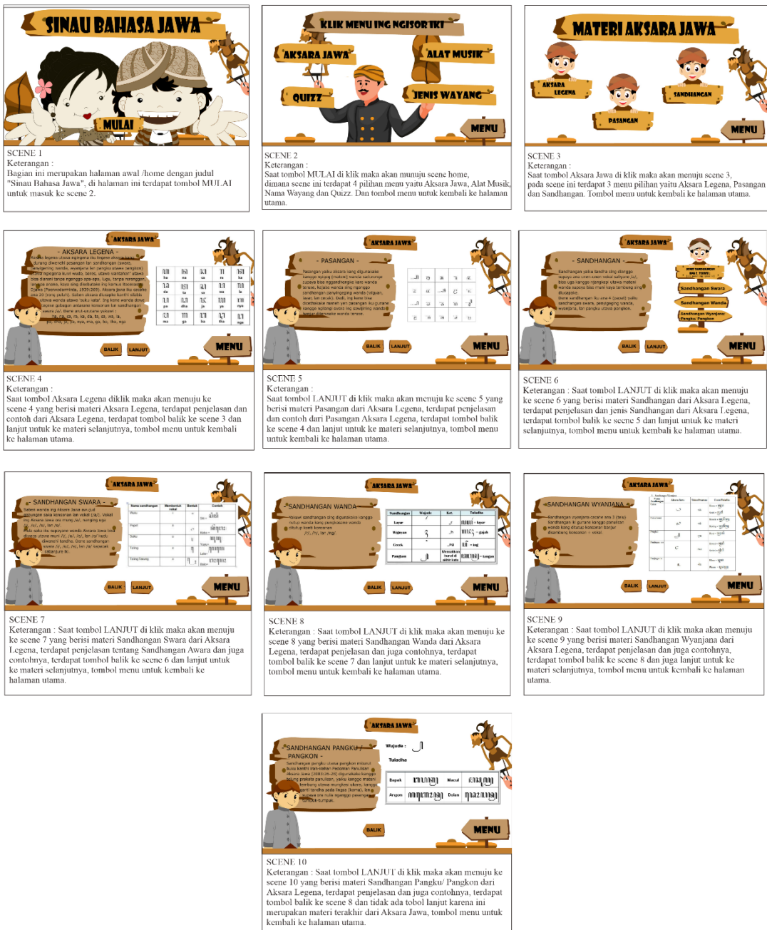
Gambar 1. Storyboard