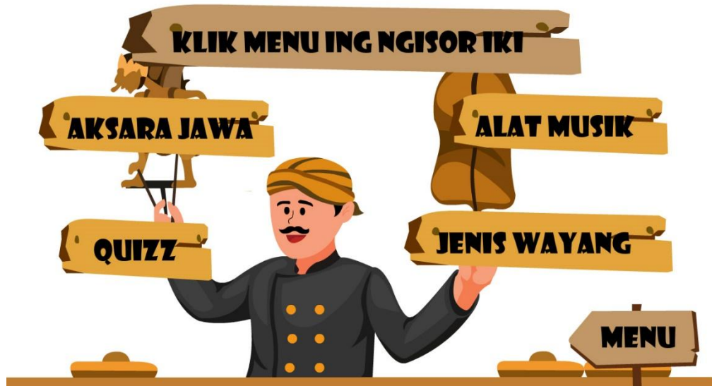
Gambar 3. Tampilan Menu

Gambar diatas merupakan halaman tampilan pada menu dengan berisikan aksara jawa, alat music, quiz, jenis wayang.