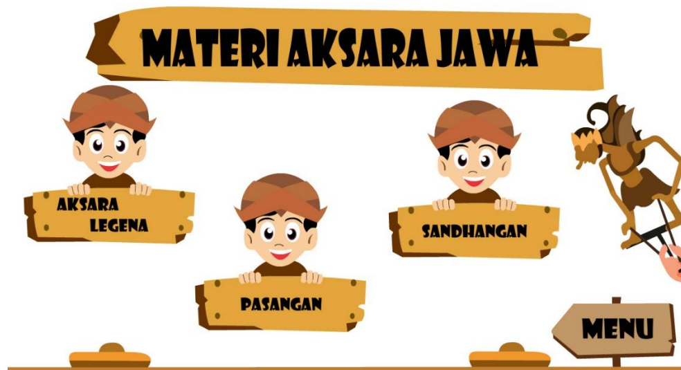
Gambar 4. Tampilan Materi Aksara Jawa

Gambar diatas merupakan tampilan pengenalan materi aksara jawa dengan berisikan aksara legena, sandhangan, pasangan.