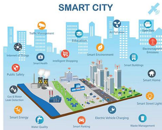
Gambar 1. Ilustrasi Pengembangan Smart City

Transformasi digital merupakan proses perubahan strategis yang memanfaatkan teknologi digital untuk meningkatkan kinerja organisasi, layanan, dan nilai bagi pengguna. Menurut Vial (2021), transformasi digital adalah proses di mana organisasi mengintegrasikan teknologi digital untuk mengubah model bisnis, proses operasional, dan pengalaman pengguna secara fundamental. Dalam konteks pemerintahan dan Smart City , OECD (2020) menyatakan bahwa transformasi digital berfungsi untuk meningkatkan transparansi, efisiensi pelayanan publik, serta pengambilan keputusan berbasis data.