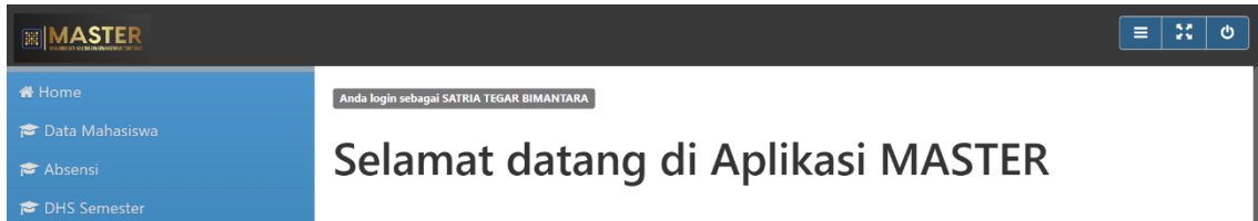
Gambar 2. Desain Awal: Navigasi flat-list yang Memicu Disorientasi.