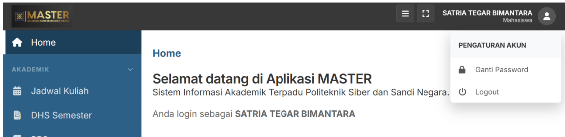
Gambar 3. Desain Yang Diusulkan (Redesign): Implementasi Arsitektur Informasi yang Dikelompokkan dan Modernisasi Tata Letak.

Lebih lanjut, integrasi modul Rencana Pembelajaran Semester (RPS) secara eksplisit ke dalam navigasi utama kategori Akademik dilakukan untuk memenuhi kebutuhan transparansi informasi (Laksamana & Purwaningsih, 2021). Pada aspek estetika, pembersihan kebisingan visual (visual noise) dan relokasi manajemen akun ke dalam dropdown profil diterapkan untuk membangun ruang visual yang lebih profesional dan terarah.