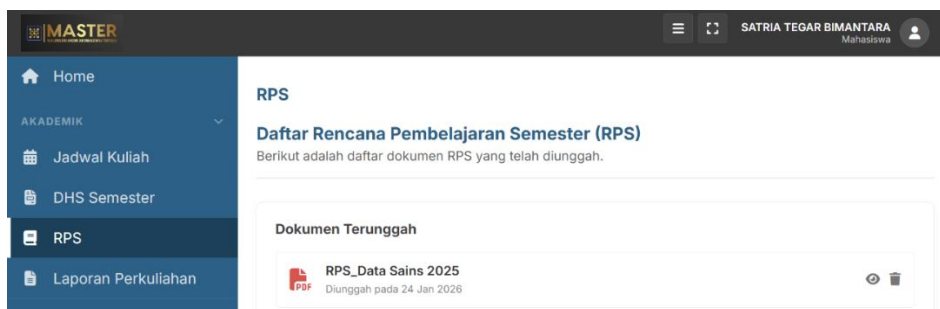
Gambar 4. Integrasi Menu RPS pada Navigasi Kategori Akademik.

Lebih lanjut, integrasi modul Rencana Pembelajaran Semester (RPS) secara eksplisit ke dalam navigasi utama kategori Akademik dilakukan untuk memenuhi kebutuhan transparansi informasi (Laksamana & Purwaningsih, 2021). Pada aspek estetika, pembersihan kebisingan visual (visual noise) dan relokasi manajemen akun ke dalam dropdown profil diterapkan untuk membangun ruang visual yang lebih profesional dan terarah.