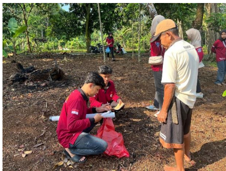
Gambar 1. Pemotongan dan Pelubangan Pipa.

Pertama, pipa PVC dipotong sesuai ukuran yang telah ditentukan. Pipa utama (diameter 3/4 inci) dilubangi berbentuk segitiga sebagai jalur keluar pupuk dan diberi alur untuk sekrup pengatur menggunakan gerinda.