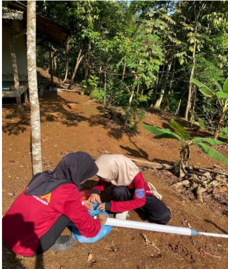
Gambar 2. Perakitan Mekanisme Pemicu.

Kedua, pipa berdiameter lebih kecil (1/2 inci dan 3/4 inci) dirakit bersama dengan karet ban bekas dan sekrup untuk menciptakan mekanisme pemicu. Karet berfungsi sebagai pegas yang mengontrol buka-tutup lubang pupuk.