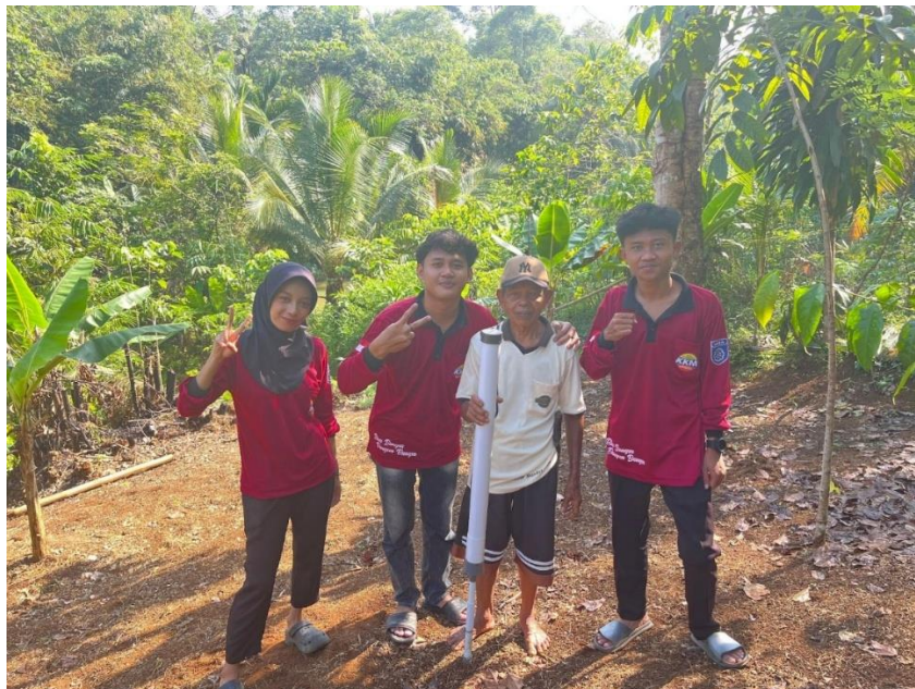
Gambar 3. Penyatuan Komponen.

Ketiga, mekanisme pemicu yang sudah jadi dimasukkan ke dalam badan alat utama (pipa 2 inci). Bagian atas dan bawah pipa kemudian ditutup dengan penutup yang sesuai.