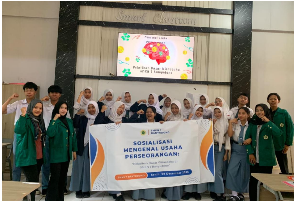
Gambar 4. Foto Bersama Peserta Sosialisasi.