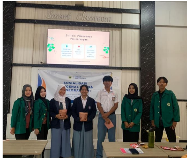
Gambar 3. Apresiasi Kepada Siswa Aktif.

Secara keseluruhan, hasil kegiatan pengabdian ini menunjukkan bahwa proses pendampingan yang dilaksanakan mampu menjawab permasalahan utama komunitas sasaran. Rendahnya pemahaman siswa terhadap kewirausahaan dan usaha perseorangan berhasil diatasi melalui penyampaian materi yang sistematis, penggunaan media PPT, contoh pengusaha muda lokal, serta sesi tanya jawab yang interaktif. Peningkatan hasil pre-test dari 70% menjadi 100% pada post-test yang menandakan adanya peningkatan pemahaman yang sangat signifikan dibandingkan dengan hasil pre-test. Peningkatan ini meliputi pemahaman konsep kewirausahaan, kepemilikan perseorangan, analisis peluang usaha, serta pemahaman karakter dan sikap wirausaha. Sehingga menunjukkan keberhasilan program secara kuantitatif, sementara perubahan perilaku, munculnya kesadaran baru, pranata sosial, dan pemimpin lokal menunjukkan dampak sosial yang lebih luas.