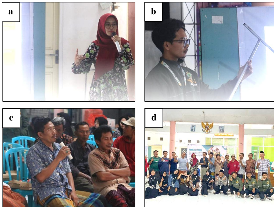
Gambar 2. Dokumentasi kegiatan (a. penyampaian materi, b. demonstrasi pembuatan, c. diskusi interaktif, d. foto bersama).