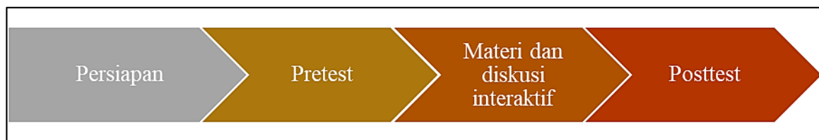
Gambar 1. Tahapan pelaksanaan kegiatan.

Tahapan akhir dari pelaksanaan adalah posttest, yang diberikan kepada peserta setelah seluruh materi disampaikan untuk mengevaluasi peningkatan pemahaman mereka setelah mengikuti sosialisasi. Evaluasi melalui perbandingan rata-rata nilai pretest dan posttest menjadi salah satu indikator keberhasilan kegiatan sosialisasi (Alam, 2019). Hasil tersebut juga dapat digunakan sebagai bahan refleksi untuk tindak lanjut kegiatan pemberdayaan kelompok tani. Secara singkat, tahapan pelaksanaan kegiatan sosialisasi disajikan pada Gambar 1.