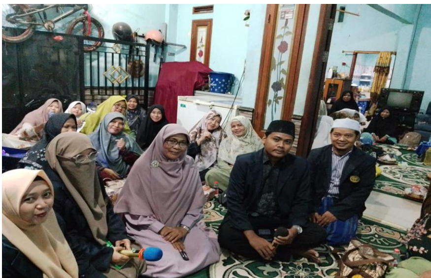
Gambar 4. Kegiatan Bersama Jama'ah Majelis Taklim Izzatin Nisa Tangerang.