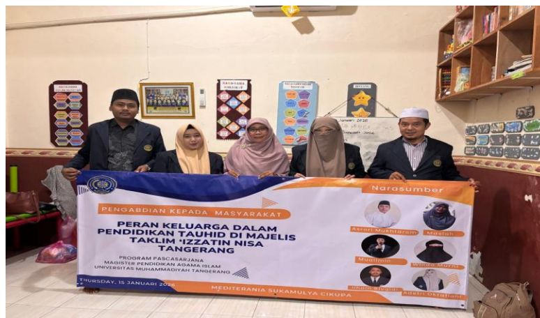
Gambar 2. Observasi di lokasi PKM Majelis Taklim Izzatin Nisa Tangerang.

Berdasarkan diskusi ini, dapat ditegaskan bahwa pendidikan tauhid melalui majlis taklim memiliki relevansi kuat dengan teori pendidikan Islam, khususnya dalam aspek pendidikan keluarga dan pendidikan nonformal. Temuan pengabdian ini memperkuat teori bahwa keberhasilan pendidikan tauhid memerlukan sinergi antara keluarga sebagai pendidikan informal dan majlis taklim sebagai pendidikan nonformal. Secara praktis, model pendidikan tauhid seperti yang dilakukan di Majelis Taklim 'Izzatin Nisa dapat dijadikan rujukan bagi pengembangan program pengabdian kepada masyarakat berbasis keagamaan di lingkungan lain. Kegiatan Pengabdian Masyarakat ini sudah di lakukan sesuai tahap yang di rencanakan dari awal pembuatan granul dari ampas echo enzim. Kegiatan ini di lakukan bersama masyarakat, tim Dosen dan Mahasiswa.