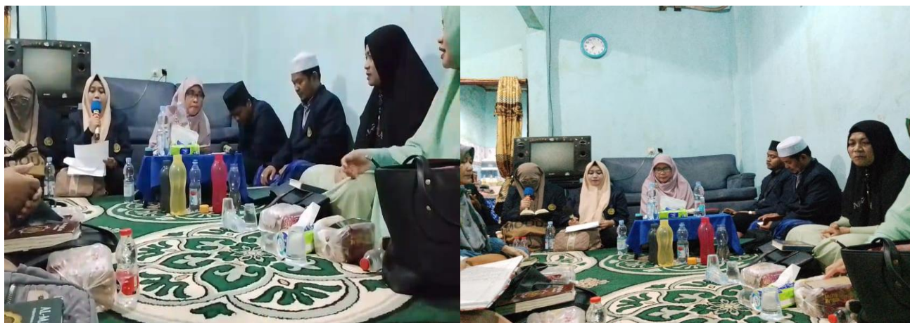
Gambar 3. Pelaksanaan Kegiatan PKM di Majelis Taklim Izzatin Nisa Tangerang.