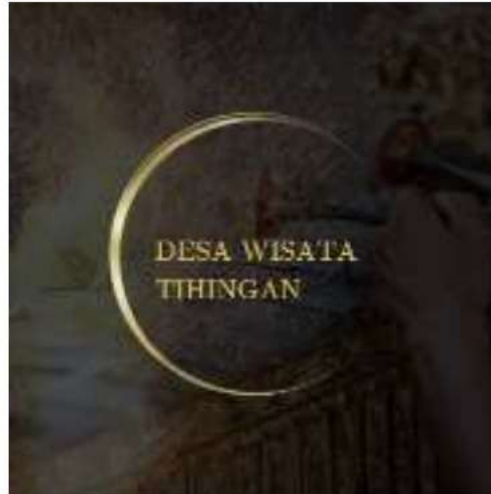
Gambar 2 foto dokumentasi