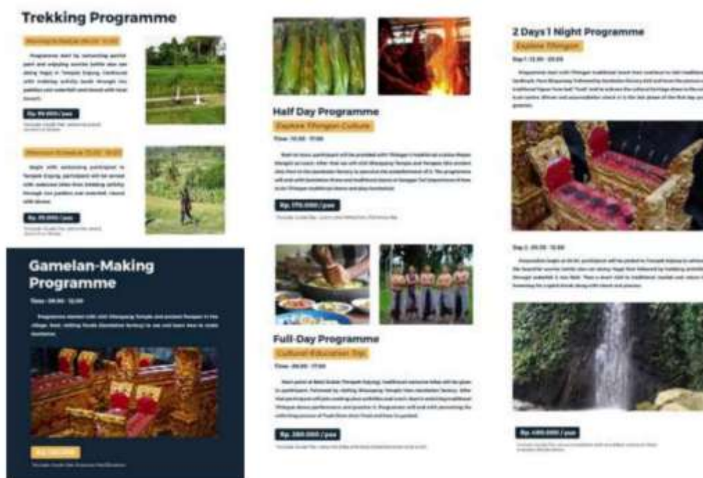
Gambar 1 foto dokumentasi

Pengemasan paket wisata berbasis aktivitas seperti trekking, cycling, dan edukasi gamelan menunjukkan integrasi antara potensi alam dan budaya sebagai satu kesatuan produk. Pendekatan ini relevan dengan tren wisata minat khusus yang menekankan pengalaman autentik, keterlibatan langsung wisatawan, serta interaksi sosial dengan masyarakat lokal. Integrasi tersebut memperkuat daya saing desa wisata sekaligus mengurangi ketergantungan pada satu jenis atraksi saja (Timothy & Nyaupane, 2020; Su & Wall, 2020; Arida & Pujani, 2020).