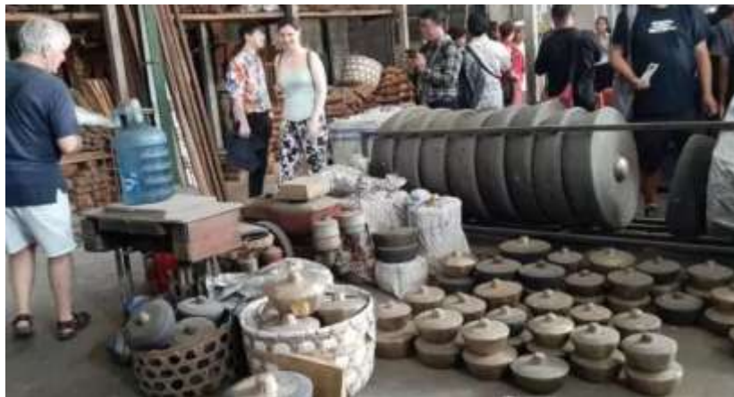
Gambar 3 foto dokumentasi

Dari perspektif kelembagaan, penguatan peran Pokdarwis menjadi capaian penting karena keberlanjutan desa wisata sangat ditentukan oleh tata kelola lokal yang efektif. Keterlibatan Pokdarwis dalam proses pengemasan paket wisata memperjelas pembagian peran, alur koordinasi, serta mekanisme pengambilan keputusan. Kondisi ini mendukung literatur yang menekankan bahwa kelembagaan lokal yang kuat berperan sebagai fondasi utama dalam pengelolaan pariwisata berbasis komunitas (Giampiccoli & Saayman, 2020; Kontogeorgopoulos et al., 2020; Wahyuni et al., 2023).