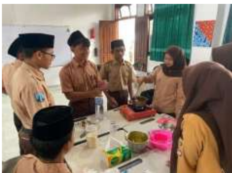
Gambar 4. Praktek pembuatan jamu kunyit asam.