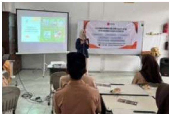
Gambar 3. Penyampaian materi.

Sebagai bentuk dari penerapan materi, siswa mengikuti praktik langsung membuat jamu kunyit asam dengan mengikuti langkah-langkah yang telah disampaikan pada saat materi disampaikan. Setelah proses pembuatan jamu selesai, jamu dikemas dalam botol dan kegiatan ditutup dengan sesi dokumentasi bersama. Rangkaian kegiatan ini dirancang tidak hanya untuk meningkatkan pengetahuan siswa SMA Wahidiyah mengenai jamu kunyit asam, tetapi juga melibatkan praktik pembuatan jamu yang membuat siswa terlibat secara aktif dan menunjukkan antusiasme tinggi selama kegiatan berlangsung, terutama saat sesi diskusi dan praktik pembuatan jamu kunyit asam.