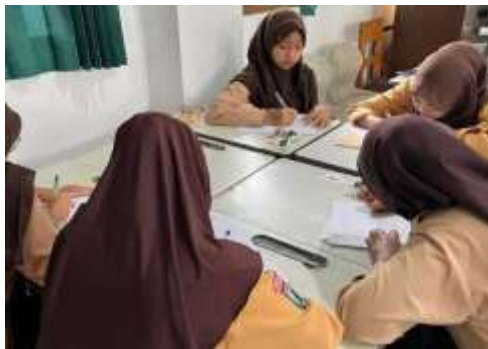
Gambar 2. Pengerjaan pre test .

Berdasarkan Tabel 1, terjadi peningkatan rata-rata skor jawaban benar dari 76,4% pada pre test menjadi 97,9% pada post test , dengan rata-rata kenaikan sebesar 18,1%. Peningkatan paling signifikan terjadi pada pertanyaan mengenai langkah mencuci tangan yang benar sebelum mengolah jamu kunyit asam, yaitu dari 20% menjadi 100% (kenaikan 80%). Selain itu, pemahaman tentang wadah penyimpanan yang aman juga meningkat dari 46% menjadi 93% (kenaikan 47%). Hal ini sesuai dengan hasil pelatihan pembuatan jamu kunyit asam yang menunjukkan peningkatan pengetahuan signifikan pada aspek kebersihan dan teknik penyimpanan (Jurnal Abditek, 2021).