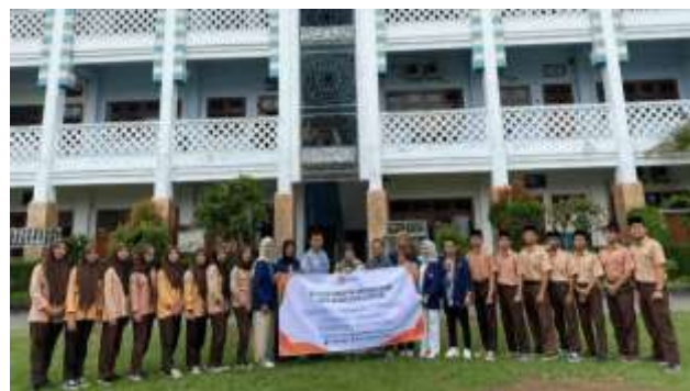
Gambar 5. Foto bersama.