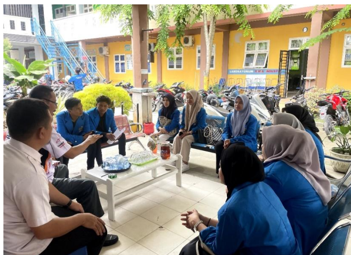
Gambar 3. Perencanaan Edukasi (Workshop, Seminar, Pelatihan)