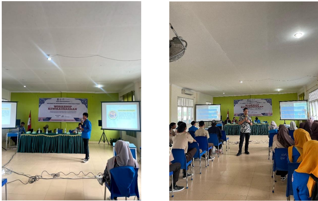
Gambar 4. Kegiatan Penyampain Workshop Kewirausahaan