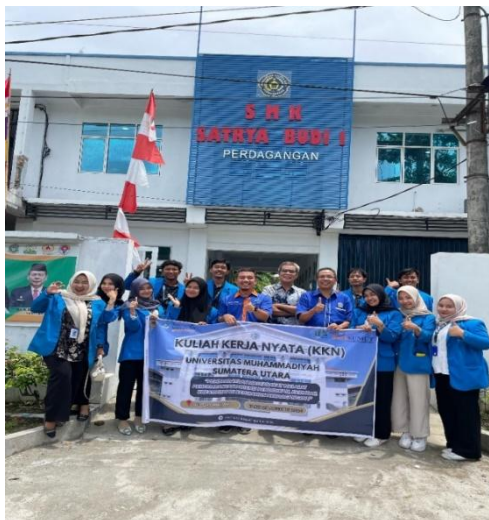
Gambar 2. Pendamping dan Monitoring Dengan Perangkat Sekolah